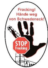
Bürgerinitiative „Hände weg vom Schwedeneck“